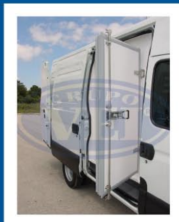
Opcionalmente pode usar Porta lateral única para distribuição de produtos congelados.