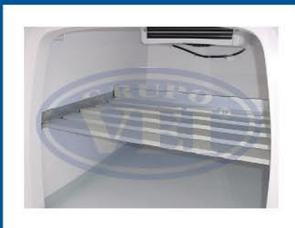
Diversos tipos de Prateleiras para maximizar a utilização do compartimento de carga.