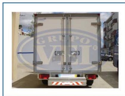
Para Veículos de Chassis Baixo (Plancher).