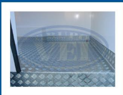
Zonas de desgaste reforçadas com protecção especial contra impactos e infiltrações.