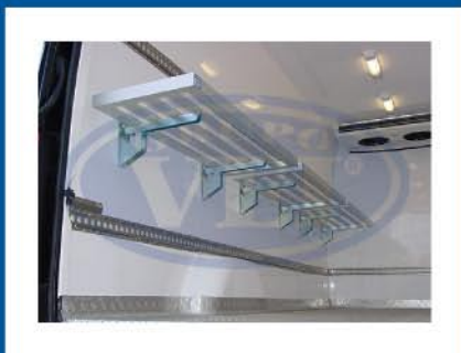
Iluminação para temperaturas negativas e de baixo consumo.