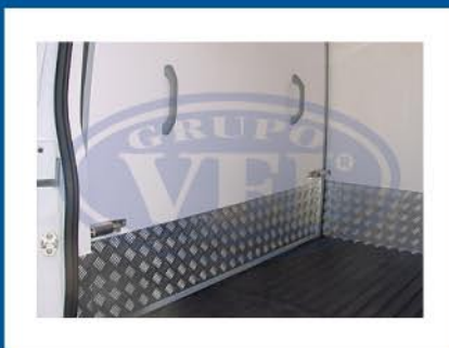
Pavimentos resistentes e imunes a infiltrações.